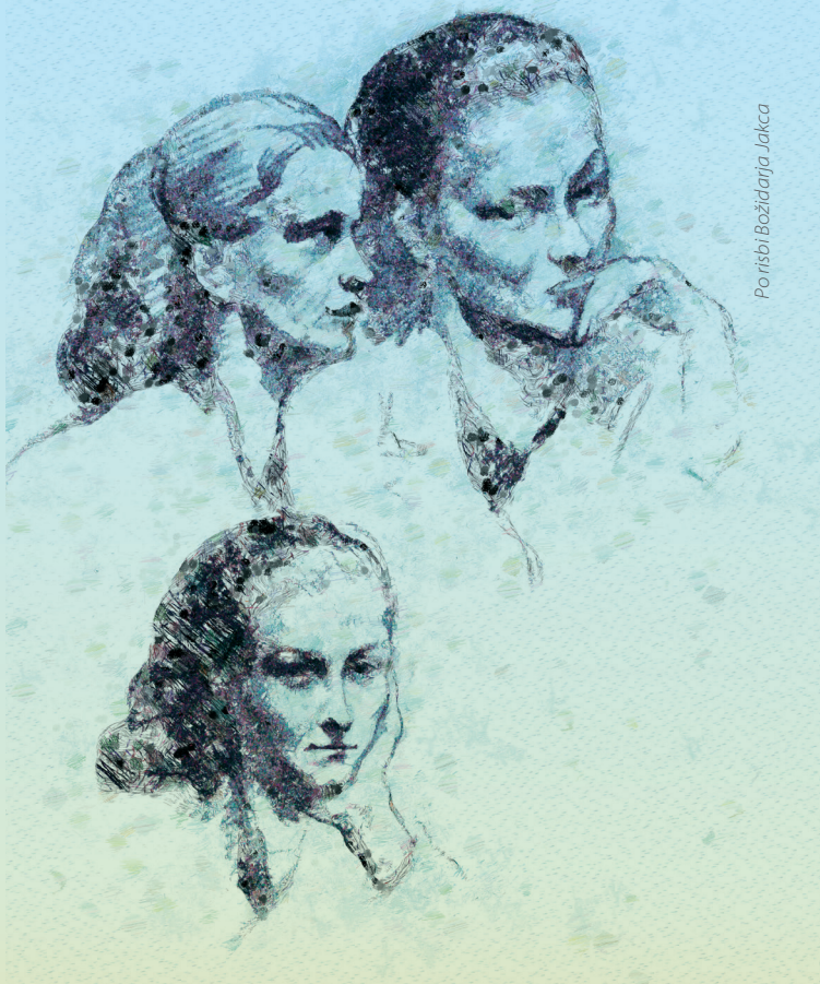
Portisbi Božidarja Jakca